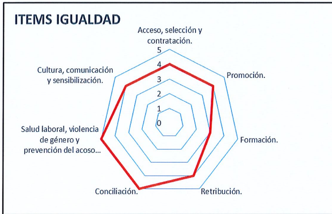
Graf.1: Representación de los puntos de mejora, escala de valoración de 0-5 de los ítems definidos por el Plan de igualdad.